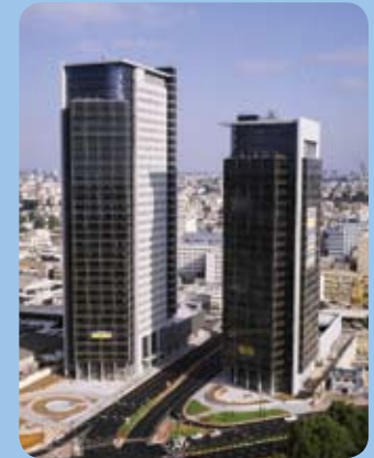
משרדי חברת אדוונטק

חברת התוכנה והטכנולוגיה אדוונטק מובילה במתן פתרונות מבוססי MICROSOFT , ORACLE , SAP ו-JAVA. באדוונטק קיים שילוב נדיר של הבנת תהליכים עסקיים / ארגוניים - בשילוב מומחיות טכנולוגית. שילוב זה מאפשר לבצע פרויקטים מורכבים, המספקים מענה למטרות ויעדי הלקוח. החברה מבצעת פרויקטים רחבי היקף בתחומים: ERP, CRM, PORTAL, BI, פיתוח והסבות תוכנה לחברות וארגונים הנמנים על המובילים במשק בארץ ובעולם. יכולת האינטגרציה של אדוונטק ושליטתה בטכנולוגיות הרבות מאפשרות לה בצוע פרויקטים מורכבים המתבססים על מגוון טכנולוגיות (Best of Breed) ומתן פתרונות ייחודיים ומקוריים. אדוונטק הינה חברה ציבורית הנסחרת בבורסה לני"ע בתל-אביב (ADVT). אדוונטק מציעה שירותים מקצועיים בכל היקף ולכל מחזור החיים של פרויקטי תוכנה, החל משלב אפיון הצרכים וגיבוש הארכיטקטורה, המשך באפיון הפיתוח ושירותי התשתית ועד לביצוע QA, הטמעה ותמיכה שוטפת. אדוונטק מונה כ-350 אנשי מקצוע. החברה פועלת תחת תקן אבטחת איכות ISO-9001 והסמכה בינ"ל ממכון BVQI באנגליה.